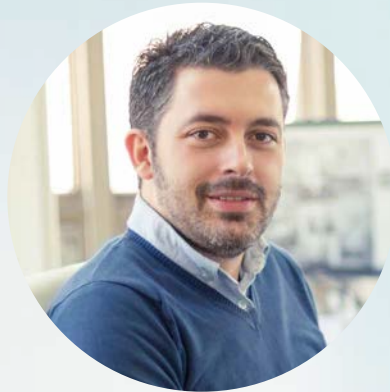
Softwarepflegekunde ohne ServicePlus-Paket